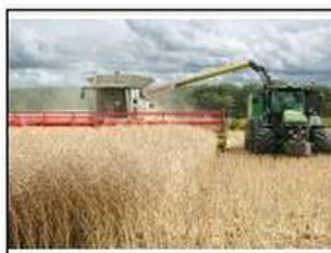
La moisson du colza.

Ça dépend des régions et de la terre! Les durées de travail sont énormes pour un revenu très inférieur à un footballeur qui tape dans un ballon. Formations : Bac pro Conduite et gestion de l'entreprise agricole Bac pro Conduite et gestion de l'entreprise vitivinicole BP Responsable d'entreprise agricole BTS Agronomie : productions végétales BTS Productions animales