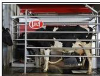
Le robot de traite a des avantages (travail en moins) et inconvénients (coûts en plus).