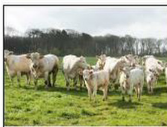
Un élevage de boeufs en pâturage au grand air.