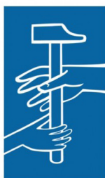
Outil en Main