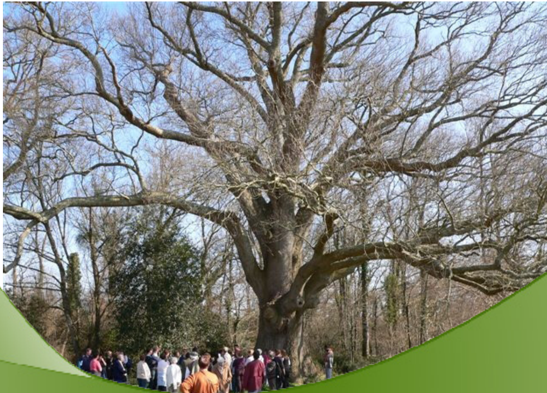
Chêne du Repéré