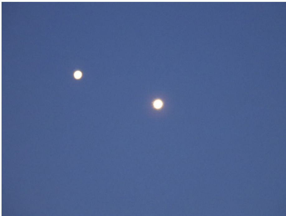
Jupiter à gauche et Vénus à droite.

V ous avez été nombreux à avoir remarqué un phénomène céleste exceptionnel, plein ouest après le coucher du soleil, au début du mois de mars. Cet évènement astronomique concernait le rapprochement (optique) progressif des planètes Vénus et Jupiter. Jupiter, qui était au plus haut dans le ciel, s'est rapproché petit à petit de Vénus pour la dépasser. Ce rapprochement uniquement visuel est assez rare et comme il concerne les deux planètes les plus brillantes, il est facilement observable par tous à l'œil nu. Pour les puristes, cet événement s'appelle une CONJONCTION . Ci-dessous, une photo prise au moment où les deux planètes étaient visuellement au plus proche.